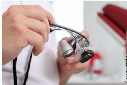
Wurzelbehandlung mit Hilfe der Lupenbrille: Die Vergrößerung ermöglicht exakteres Arbeiten und bessere Ergebnisse.

Das kann zur Folge haben, dass die Wurzelkanäle nicht vollständig gefüllt und abge-